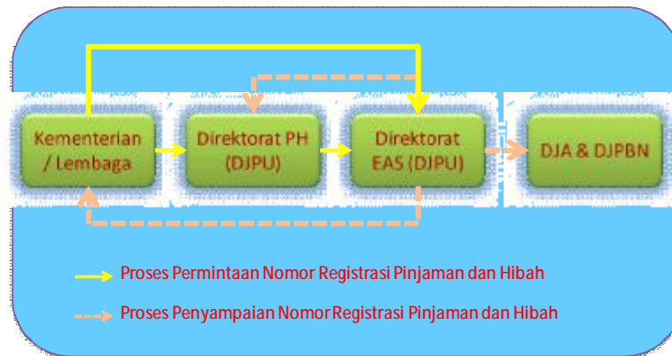
Proses Penerbitan Nomor Registrasi

Terkait dengan proses pengesahan atas penyerahan aset yang dilakukan K/L kepada Pemda, tidak perlu dilakukan proses permohonan nomor register.