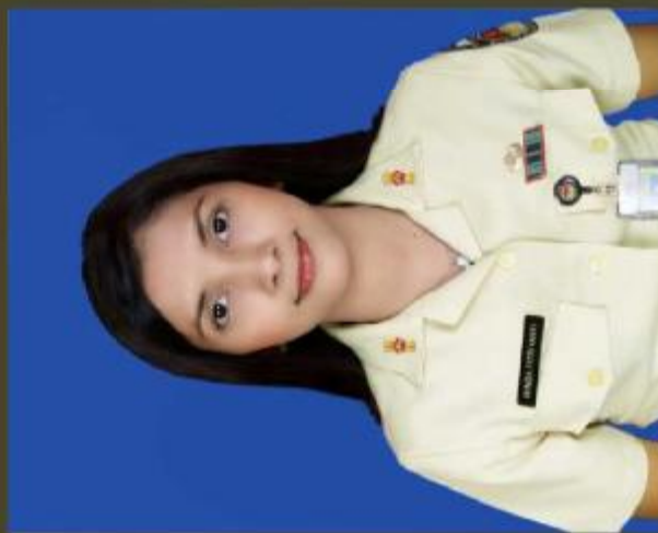
Contoh Tanda Pangkat Pengatur III/c